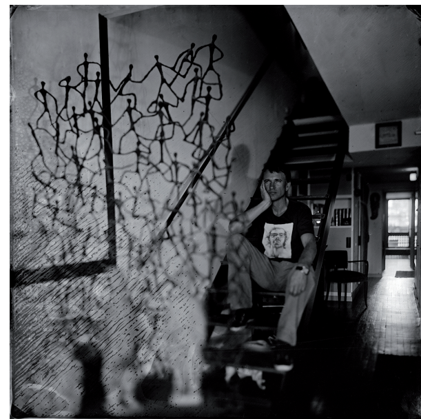
Photos des habitants de la cité radieuse Le Corbusier